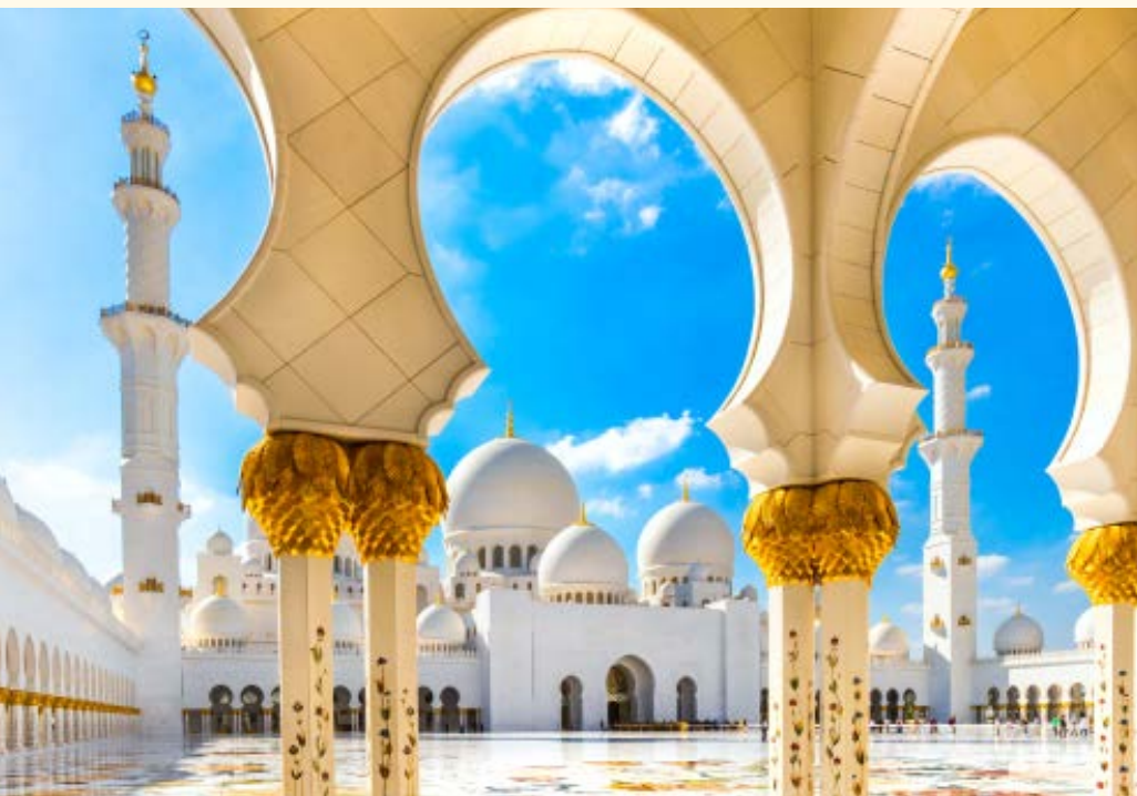
Sheikh-Zayed-Moschee in Abu Dhabi