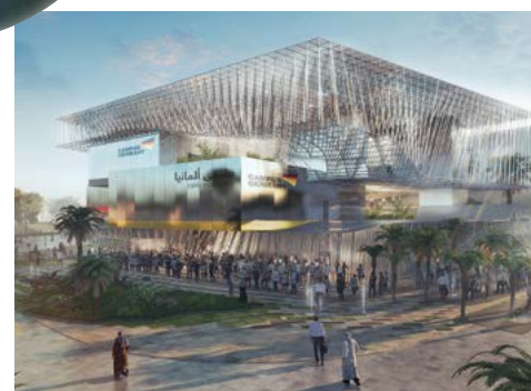
Der deutsche Pavillon

Am Nachmittag zeigen wir Ihnen dann zunächst während einer ca. 3-stündigen Stadtrundfahrt viele Sehenswürdigkeiten der Me-