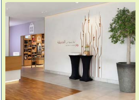
Lobby des Hotels Hilton Garden Inn