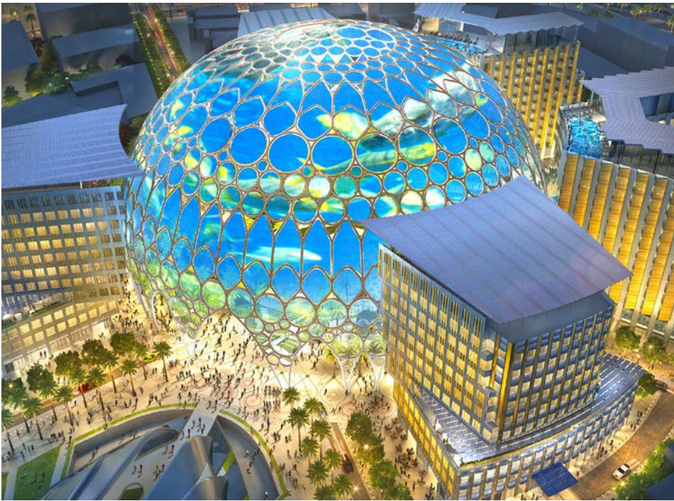
Herzstück im Zentrum des EXPO-Geländes: die Al Wasl Plaza