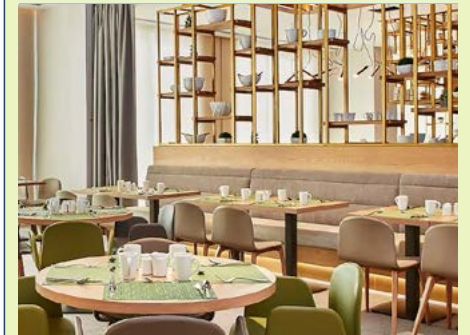
Frühstücksraum im Hilton Garden Inn