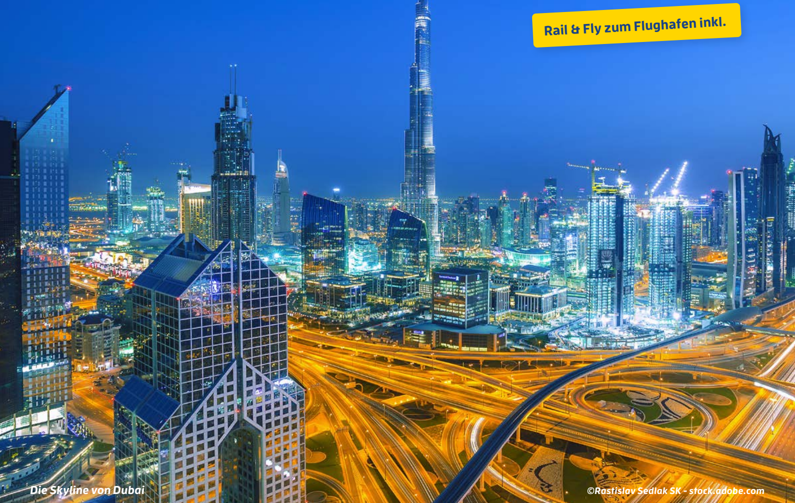
Die Skyline von Dubai